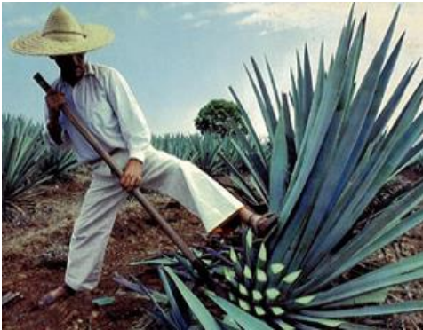
Jimador bei der Agavenernte